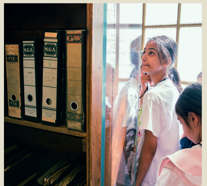
Heute befindet sich im Amsterdamer Hinterhaus ein Museum. Besucher*innen aus der ganzen Welt können sich hier ein Bild vom ehemaligen Versteck der acht Untergetauchten machen.

Die Ausstellung wurde im Rahmen des Anne Frank Tags 2026 entwickelt.