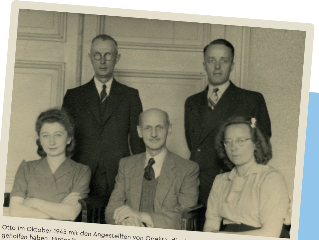
Otto im Oktober 1945 mit den Angestellten von Opekta, die den Untergetauchten im Versteck geholfen haben. Hinter ihm stehen Johannes Kleiman und Victor Kugler, neben ihm sitzen Miep Gies und Bep Voskuijl.

Das Tagebuch erzählt auch von denen, die den Familien Frank und van Pels und Fritz Pfeffer geholfen haben. Sie haben harte Strafen riskiert, um sich für verfolgte Menschen einzusetzen.