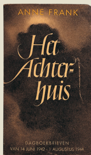
»Het Achterhuis« ist die erste Veröffentlichung von Annes Tagebuch auf Niederländisch.