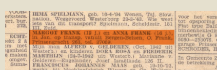
Otto sucht mit dieser Zeitungsanzeige nach seinen Töchtern. Eine Holocaust-Überlebende hat ihm kurz zuvor von Ediths Tod im Konzentrationslager Auschwitz erzählt.